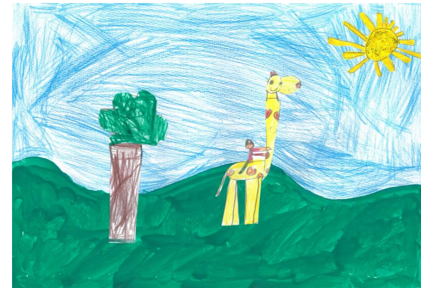
Léo saute sur le dos d'une girafe.